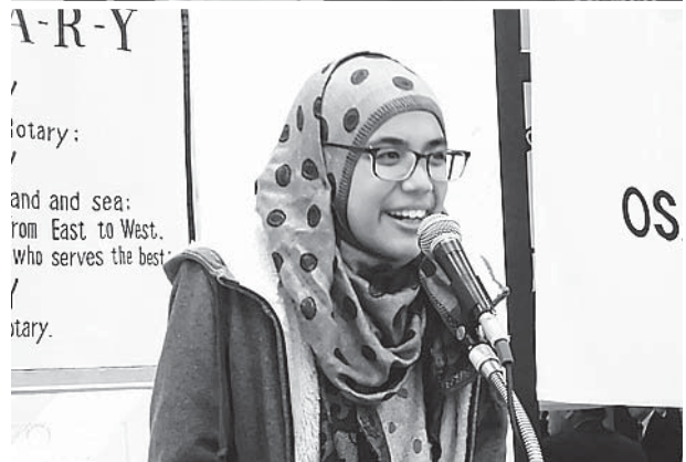
▲ ザッチャン、米山終了の挨拶